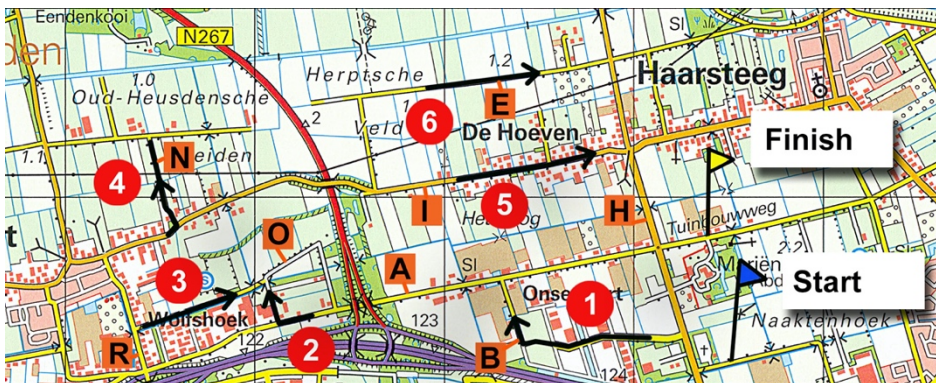
Wedstrijdkaart met controles (krijg je na de finish)

Juiste volgorde controles: Start-B-A-O-R-O-R-N-I-H-A-R-E-H-Finish